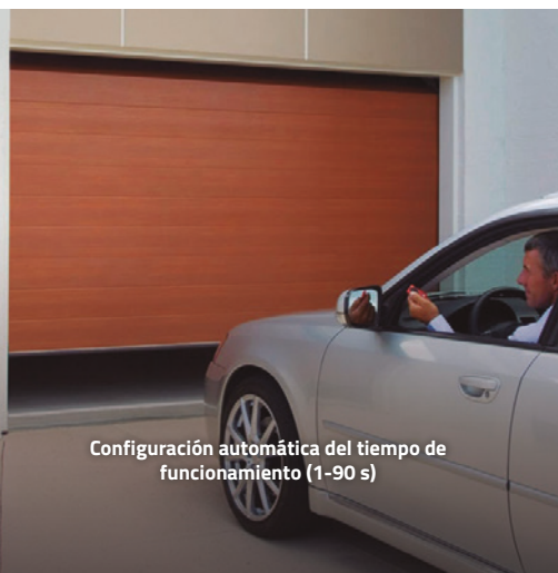
Configuración automática del tiempo de funcionamiento (1-90 s)